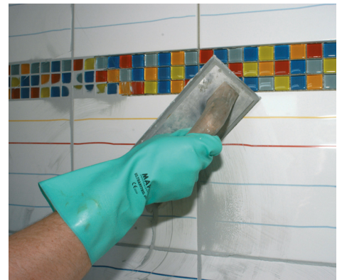
PCI Nanofug är mycket smidig och enkel att arbeta in i fogarna.