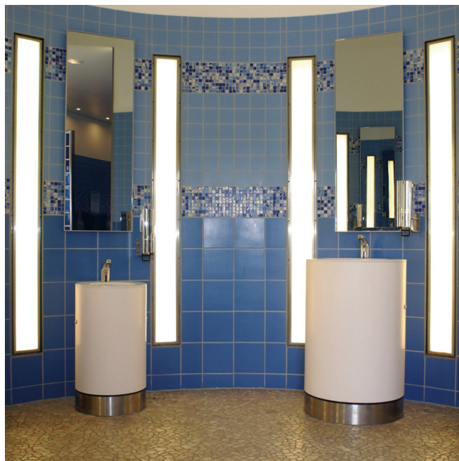
Universal tillämpning - för alla fogbredder och alla keramiska plattor.

Fogar i vinklar och i övergång till andra material fogas med PCI Silcoferm S.