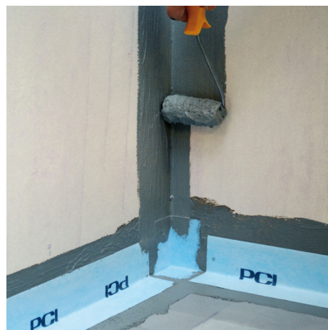
Golv/vägg-vinkeln tätas med PCI Tätband som limmas fast med PCI Pecilastic W Lim.