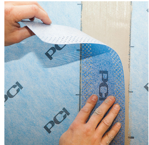
PCI Pecitape 100 P Band monteras över skarven i våtrumssystem VG2013.