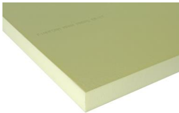
Finnfoam XPS, rak kant.

Finnfoam® XPS har testats enligt gällande normer tryck och för vattenabsorption både vid nedsänkning och diffusion.