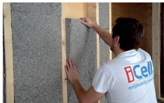
iCell Skiva är lätt att hantera, dammar minimalt och inte minst suverän ur arbetsmiljösynpunkt