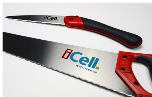
iCell Såg har utvecklats tillsammans med Bahco.