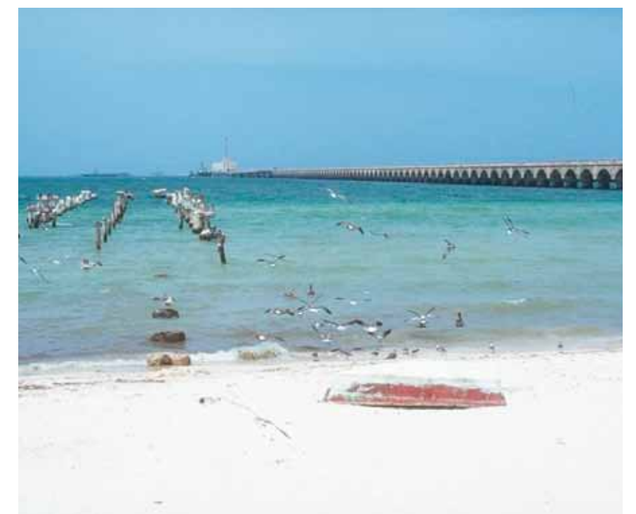
Piren till höger är armerad med rostfritt och står kvar efter många år i aggressiv miljö med vatten, värme och salt. Piren till vänster fick ett betydligt kortare liv på grund av materialval.