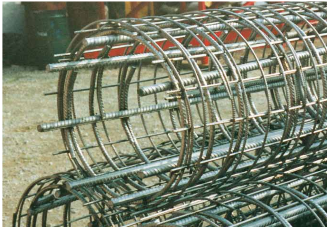
Svetsade pelarkorgar i rostfritt används med fördel där konstruktionen utsätts för t ex vägsalt, stora temperaturvariationer och mekanisk nötning.