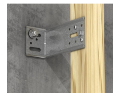
Fastgørelse af trælægte på stål