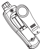
Figure4. Replacing the Battery