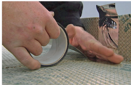
Tejpa samtliga skarvar med dB-Tejp