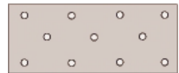
40 x 2,0/3,0 mm Ø5,0

*Kontrollera erforderligt antal spik. L = Lagervara, D = Direktleverans, 4 veckors leveranstid.